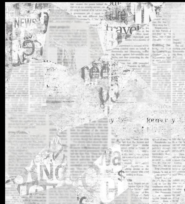
Opinia psychologiczno- pedagogiczna