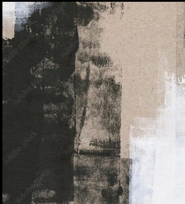
Orzeczenie z informacją o zaburzeniu zdrowotnym